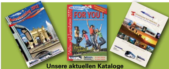
Unsere aktuellen Kataloge

Nach über 24 Stunden Fahrzeit kamen alle 850 Pilger wieder wohlbehalten zu Hause an. Ein herzlicher Dank gilt den Fahrern und allen Organisatoren. Nur durch ihren unermüdlichen Einsatz wurde diese Fahrt für alle Teilnehmer ein voller Erfolg. Hatte doch die Firma Hülsmann Reisen mehr als 5% der deutschen Pilger nach Spanien verbracht.